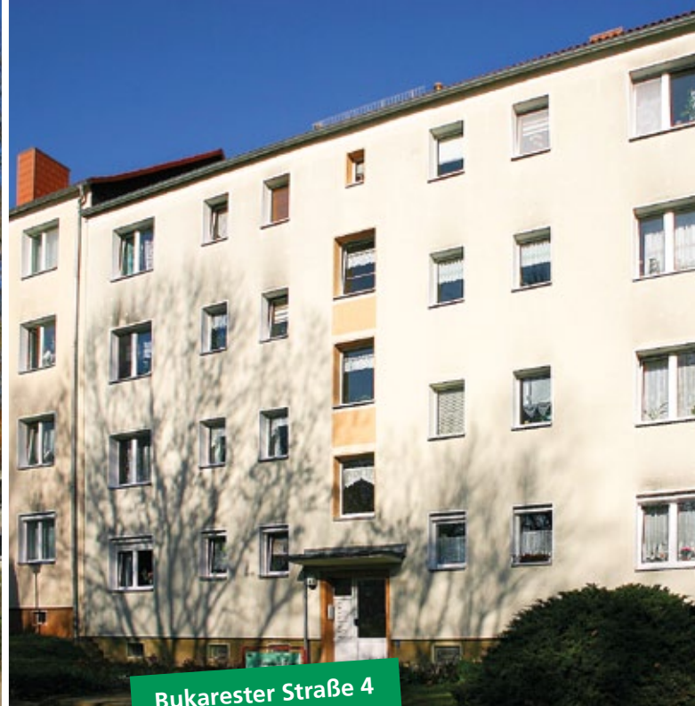
Bukarester Straße 4