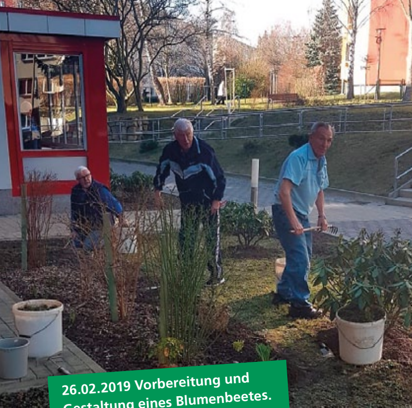
26.02.2019 Vorbereitung und Gestaltung eines Blumenbeetes.