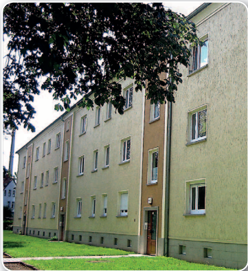
Albrechtstraße 30, ca. 80 m 2 Tageslichtbad, Gärten in der Nähe, Schöner Hinterhof Kindergarten in der Nähe