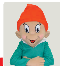
DER ZWERG „WILLI“