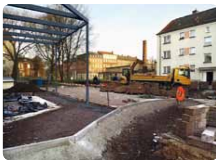
Hochwasserschädenbeseitigung Innenhof Schädestraße

In der Donaliesstraße wird nach Abschluss der Arbeiten in der Schädestraße geputzt und gemalert. Diese